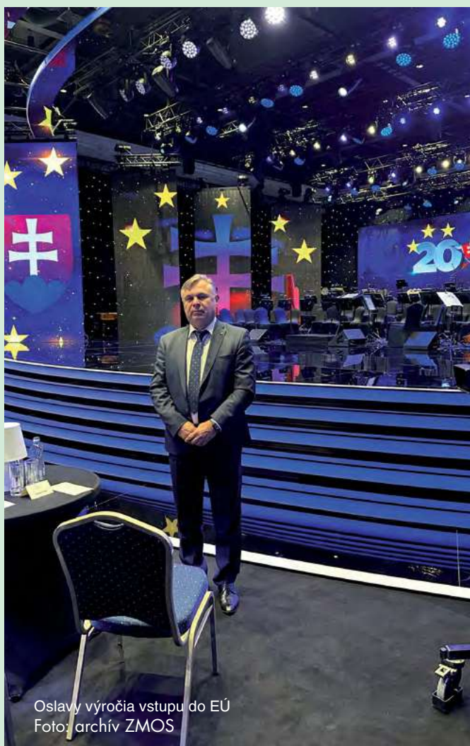
Oslavy výročia vstupu do EÚ

Dňa 1. mája 2024 som sa na základe pozvania predsedu vlády zúčastnil 20. výročia osláv vstupu Slovenska do Európskej únie na Bratislavskom hrade. Spoločne s