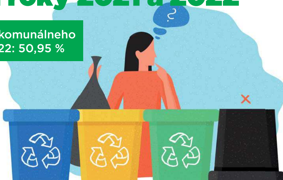
Tabuľka č. 1

Sadzba poplatku pre rok 2023 za uloženie zmesového komunálneho odpadu (200301) a objemného odpadu (200307) na skládku odpadov v EUR/1 tonu (platná od 01.03.2023 – 29.02.2024): 15,00 EUR . V zmysle zákona sa tento poplatok má zapo-