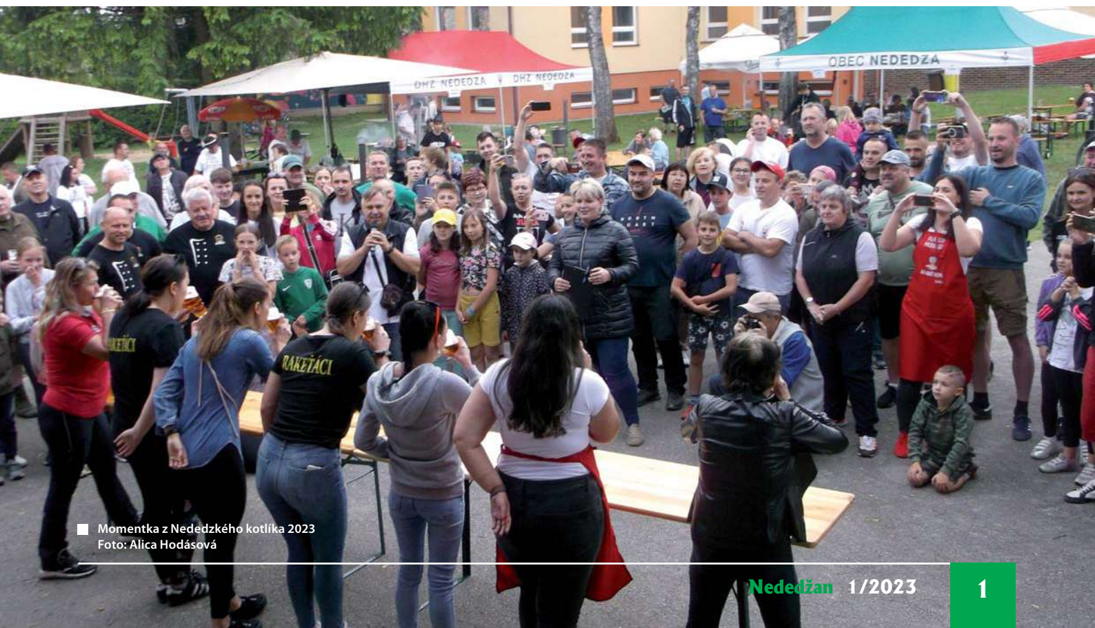
■ Momentka z Nededzského kotlíka 2023