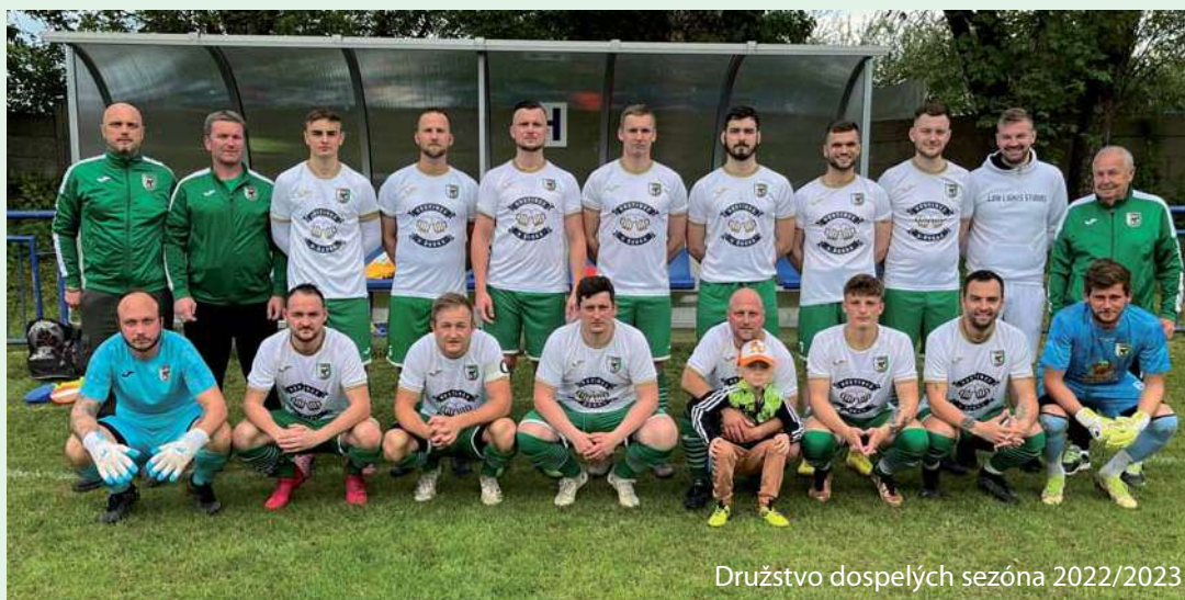
Družstvo dospelých sezóna 2022/2023