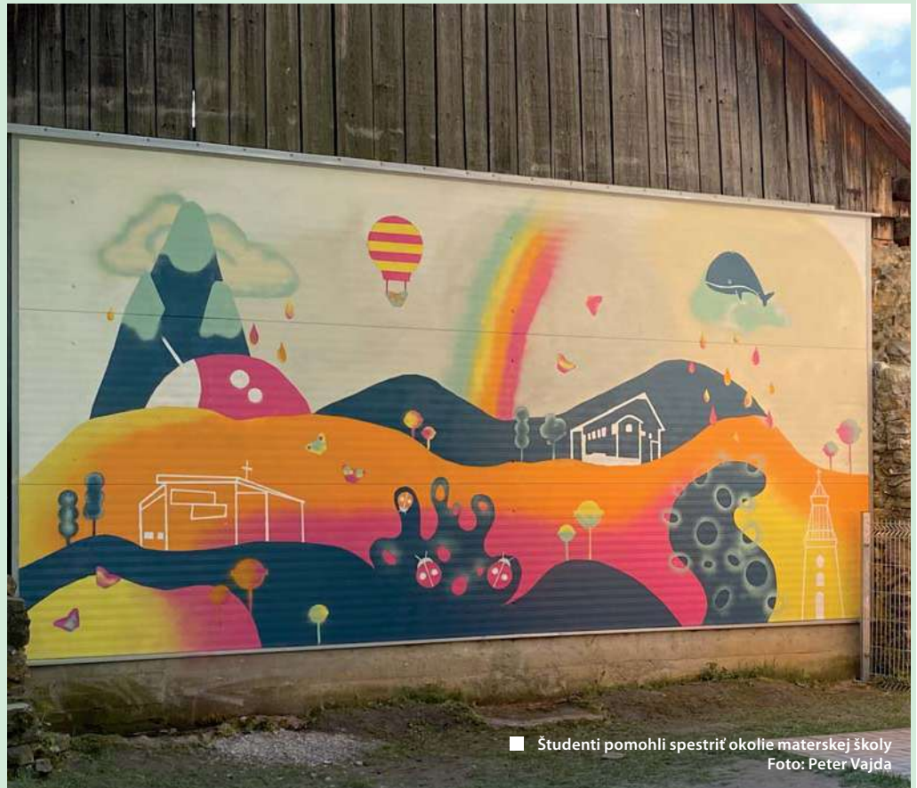
■ Študenti pomohli spestriť okolie materskej školy

30. septembra sa budú konať voľby do Národnej rady Slovenskej republiky a to v