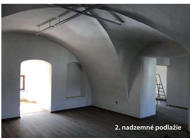
2. nadzemné podlažie