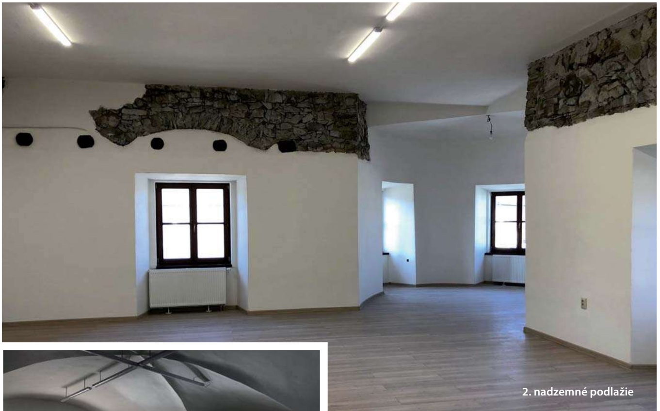
2. nadzemné podlažie