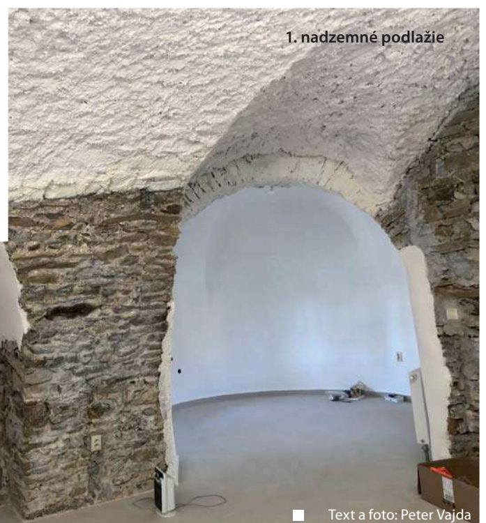
1. nadzemné podlažie

V tomto roku je pre obec termín dokončenia rekonštrukcie kaštieľa. Plánovaný je na koniec mája, aj keď v dôsledku aktuálnej situácie s koronavírusom sa môžu niektoré drobnosti pri ukončení oddialiť. Prinášame Vám aktuálny pohľad z interiéru z časti interiéru 1. a 2. nadzemného podlažia. Aj keď obec má zámer s využitím, o konečnom rozhodnutí bude debata tak v obecnom zastupiteľstve, s odborníkmi, ako aj s občanmi.