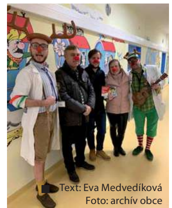
■ Text: Eva Medvedíková