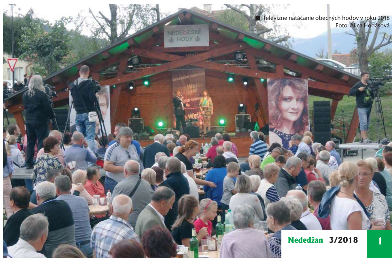
■ Televízne natáčanie obecných hodov v roku 2018