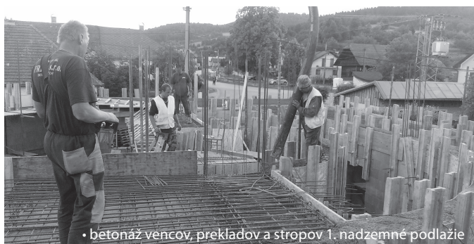
• betónáž vencov, prekladov a stropov 1. nadzemné podlažie