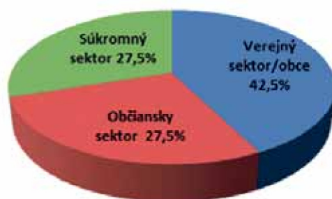
% podiel členov MAS