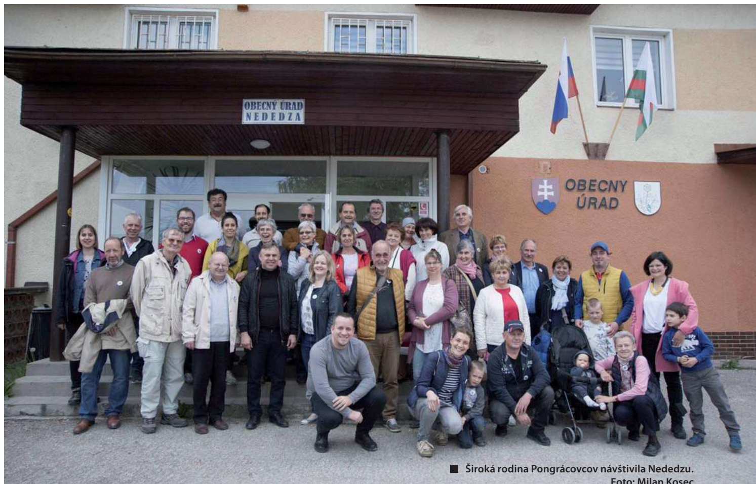
■ Široká rodina Pongrárcovcov navštívila Nededzu.