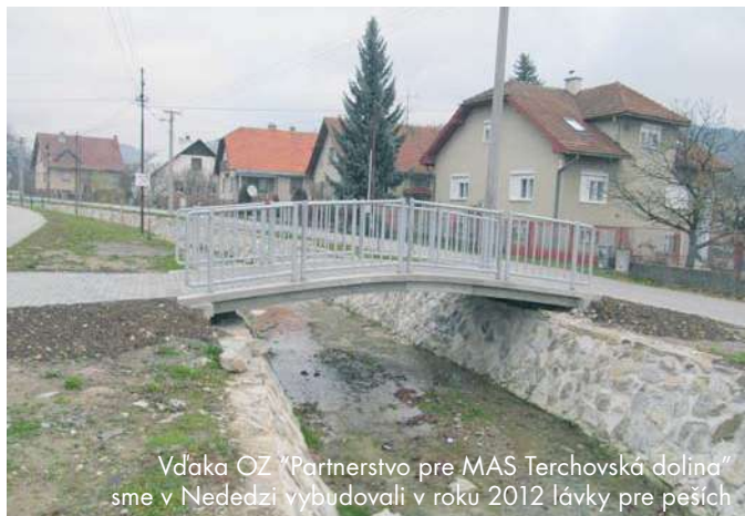
Vďaka OZ "Partnerstvo pre MAS Terchovská dolina" sme v Nededži vybudovali v roku 2012 lávky pre peších