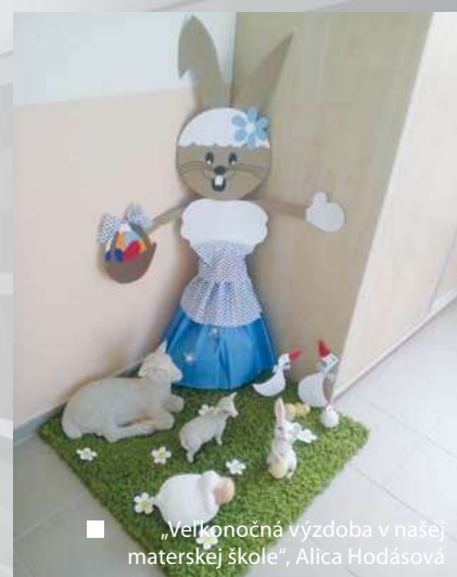
„Veľkonočná výzdoba v našej materskej škole“, Alica Hodášová