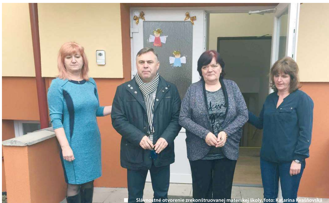
Slávnostné otvorenie zrekonštruovanej materskej školy