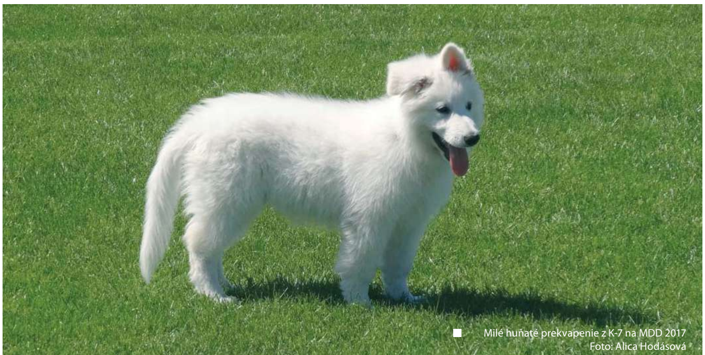
■ Milé huňaté prevkapanie z K-7 na MDD 2017